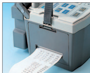
▲その場ですぐにプリントアウト (MODEL 6113のみ)