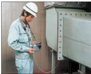
▲ダクト内の風速・静圧測定に