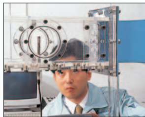
▲ダクト内の風速測定に