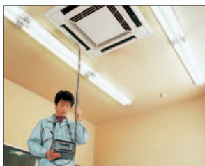
▲エアコン等の風速測定に…